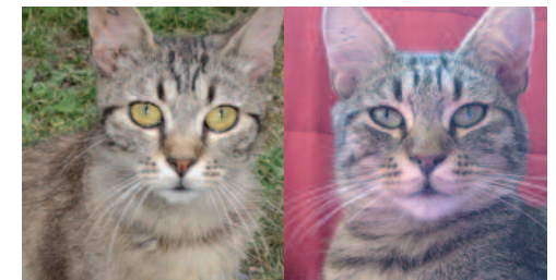
Diabolo : avant émacié et hagard, aujourd'hui dodu et serein