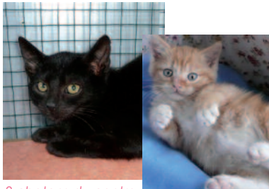
2 chatons du centre commercial Rives D'Arcins

En fin d'année, malgré un temps pluvieux, nous avons terminé des captures au centre commercial Rives d'Arcins où ces pauvres chats se nourrissaient dans les poubelles du McDonalds et par les gens de passage qui s'apitoyaient sur leur sort et leur achetaient de temps en temps un paquet de croquettes. Deux jeunes bénévoles avaient commencé à intervenir en juillet mais sans trop de succès ce qui fait qu'en novembre 2 portées de chatons sont nées.