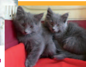
3 adorables chatons de la maison de retraite

Nous sommes aussi intervenus sur la commune de Quinsac chez une dame