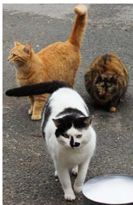
Câline (à droite), avec Rocky et Carly