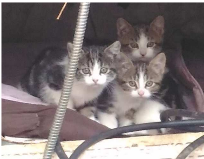
Presque chaque jour, des appels pour recueillir des chatons ...

Les appels ou messages concernant des chats trouvés, abandonnés, ou, depuis le printemps, l'arrivée de chatons signalés aux quatre coins de la Gironde ne cessent d'affluer, et il est simplement impossible de recueillir tous ces malheureux.