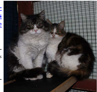
Chats trappés à Bègles, en convalescence

N'oublions pas que l'association ne compte pas de salarié, elle est constituée uniquement de bénévoles, qui donnent de leur temps, leur énergie (et leur argent !) pour venir en aide à la cause des chats de la rue.