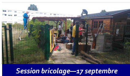
Session bricolage—17 septembre

- 1 « Vide-Local » qui a permis de collecter des fonds, grâce aux dons manuels de généreux sympathisants